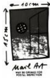
Tor zur Welt (1986)