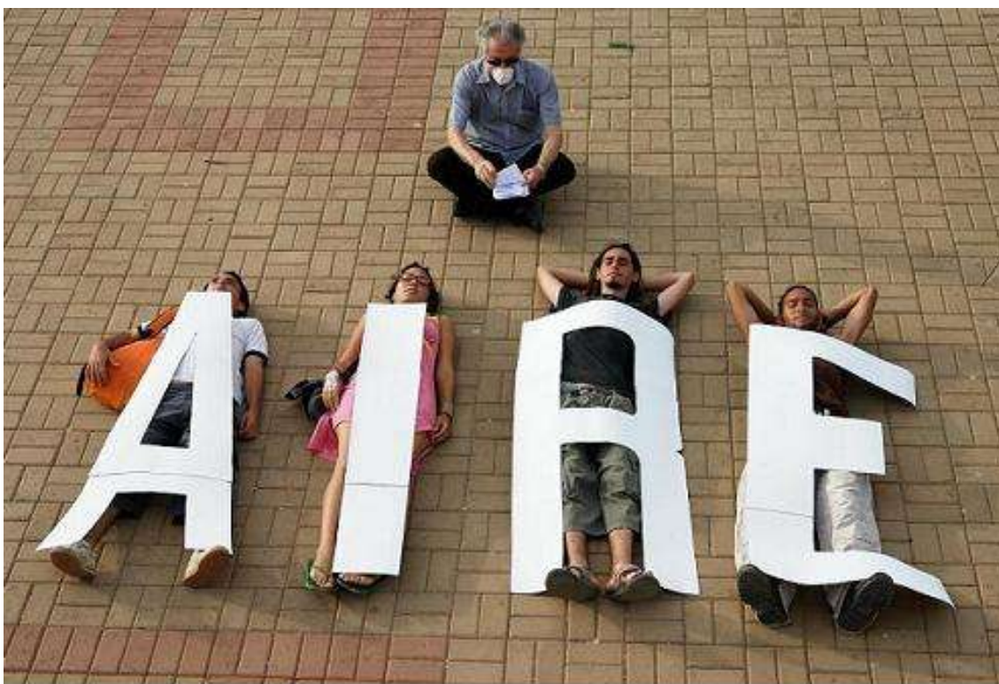
Aire, Instalación cum Performance, Edo. Falcón, Venezuela, 2007

Con esta actuación se ponía de manifiesto, la idea que esta institución tiene del arte y la cultura. Idea que no coincide con la mía. El arte no necesita ni autorizaciones, ni galerías, ni museos, ni nada por el estilo para darse. El arte no es el sistema del arte. El arte es generosidad.