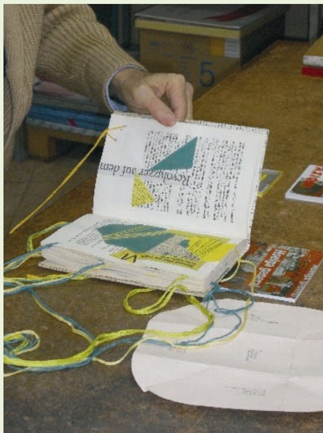
El libro de artista de Antonella Prota Giurleo.