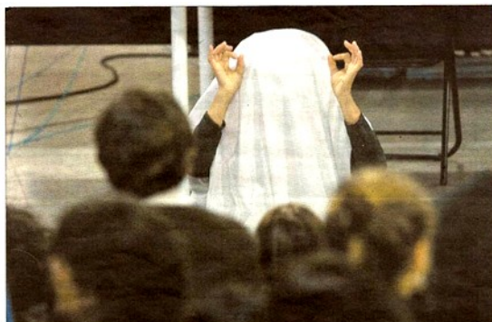
Un momento de la actuación de Esther Ferrer en el Matadero.