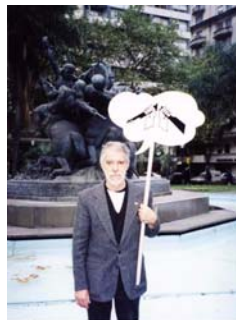
Homenaje a Guillermo Deisler Clemente Padín, Montevideo, Uruguay

En cuanto a la temática, Deisler busca subvertir el código y gestar formas libres de expresión, se manifiesta esa desconfianza en el lenguaje y las estructuras previas y anquilosadas, que se ven como armas, imanes y vehículos panfletarios del poder. Visión que ha caracterizado a la filosofía y arte desde la mitad del siglo recién pasado. No debemos ver su obra entonces, como una simple ilusión, escapismo o capricho tendencioso, sino como una alternativa deconstruccionista y re-creadora de los elementos que ya conocemos pero que en clara rebeldía y compromiso, encauzan con original fervor y forma, la profundidad del dolor humano, el anhelo de paz, de renovación, de crítica a los absurdos en la historia y las promesas que siempre descansan en la memoria individual y colectiva como una utopía o genuina acción.