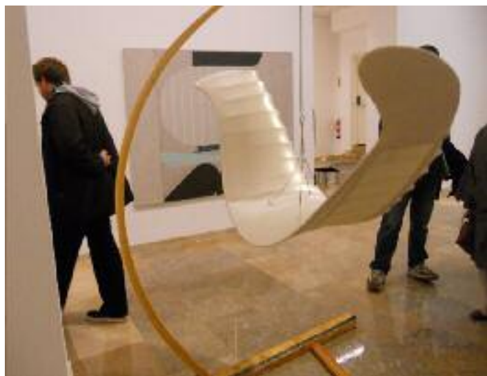
J.J. WHITE- Rumour