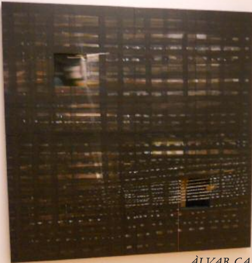
ÀLVAR CALVET "S/t -1er Premio "