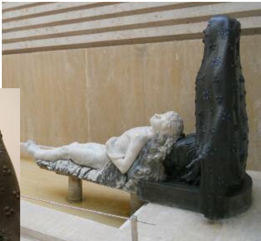
Obra de Julio Antonio: La Piedad Arriba izquierda: Retrato del autor