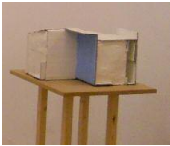
EDUARD ARBÓS- Espai Clausurat