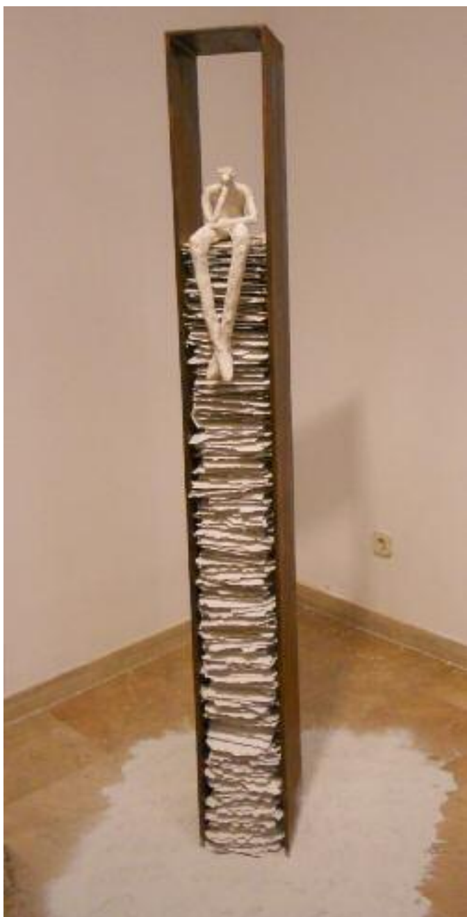
ROSER OTER- Ara