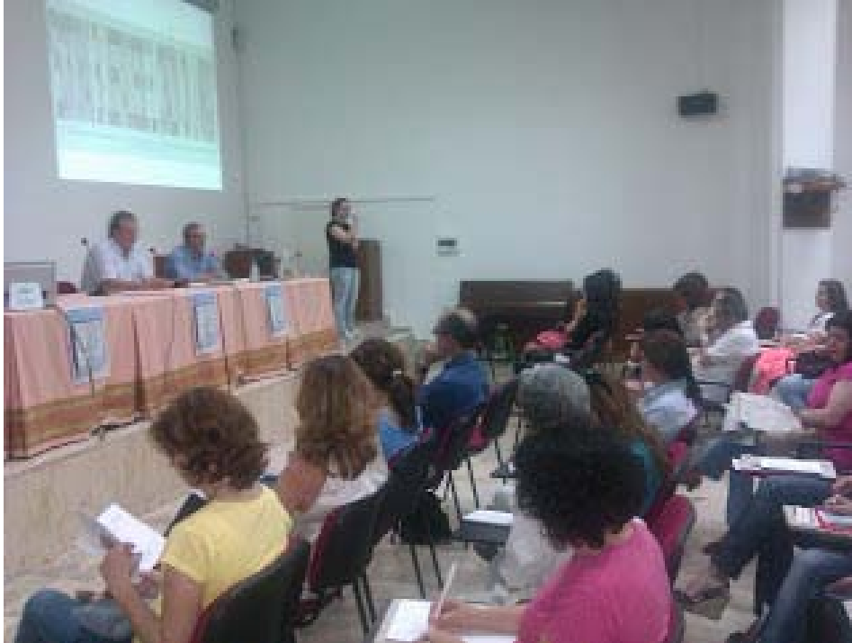
(Profesorado asistente a las Jornadas)

Visual. Su conferencia llevaba por título: " Escrituras en libertad: desde el corazón con la mirada " y merecería por sí sola varios artículos en cualquier revista especializada.