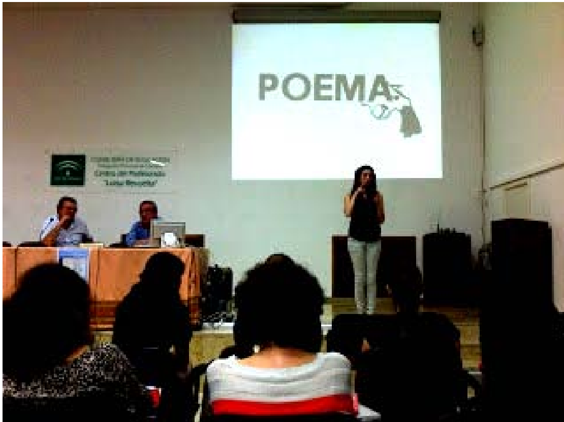
(Obra de Brossa, uno de los maestros)