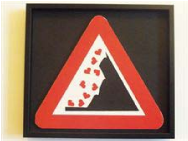
Valor de la poesía visual