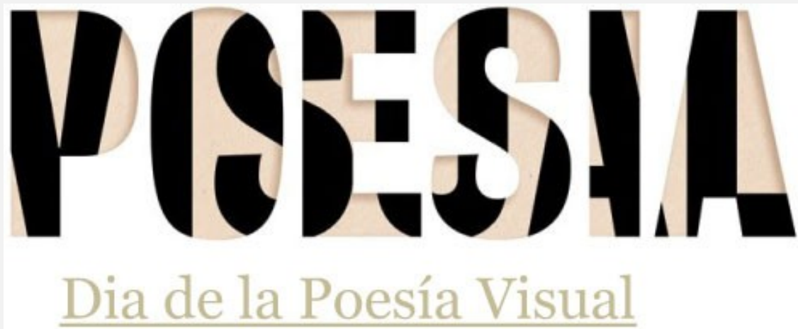
II Aniversario de la Declaracion Colectiva del Día de la Poesía Visual.