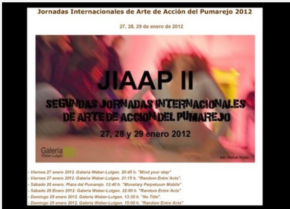
Jornadas Internacionales de Arte de AcciOn del Pumarejo 2012