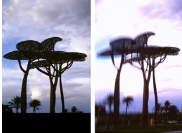
La Pineda “Mariscal”