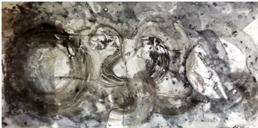
“Cartografías ondulantes I. Técnica de monotipo.”