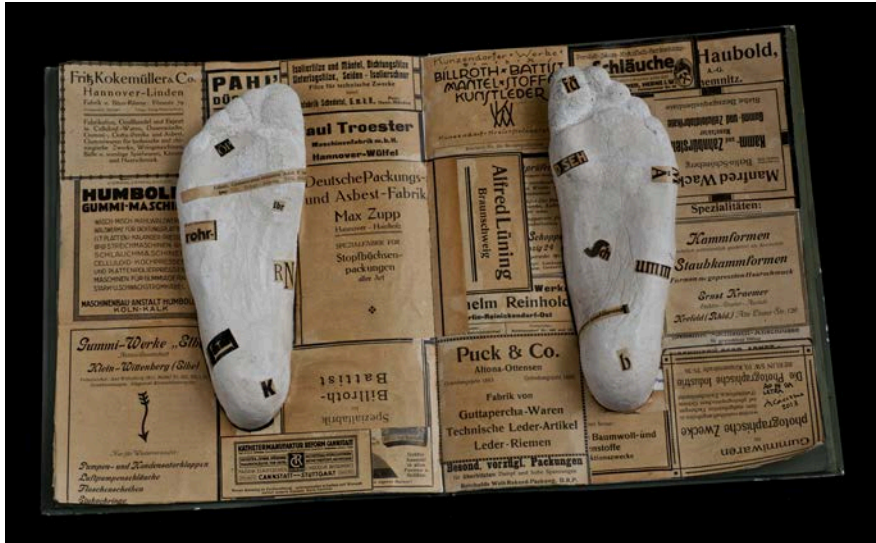
“Al pie de la letra”