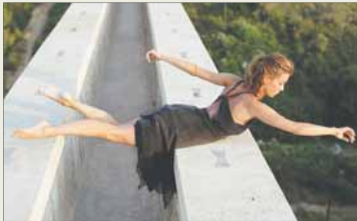
“Crossing limits” de Andrea Eidenhammer.

Y quizá lo más interesante de todo es deshilar el concepto de este mensaje más allá de los límites arquitectónicos con los que se encuentra Garau, y llevarlo a un terreno de reflexión e imaginación personal que nos pregunte: ¿cuáles son esos límites? Esas líneas que nos separan de nosotros mismos. De nuestros sueños.