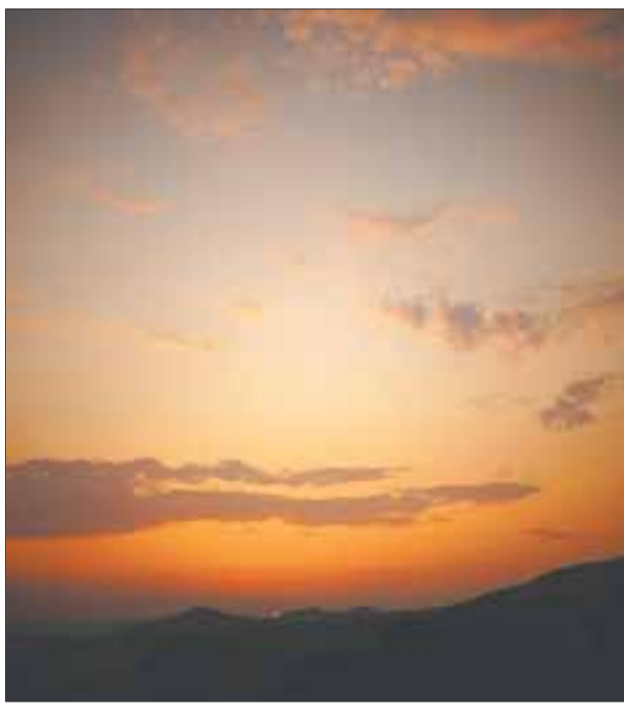
Simón y Jesús atraviesan el océano para encontrar una nueva vida al otro lado.

En un entorno ajeno, Simón cumple el papel del crítico poniendo en tela de juicio lo que nadie se cuestiona para darse cuenta, después, de que tampoco