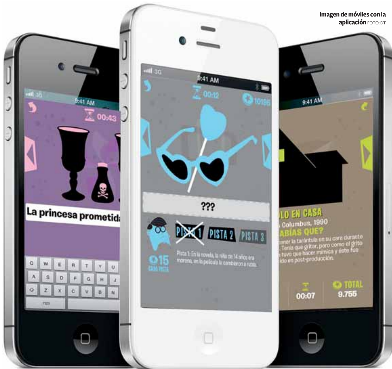
Imagen de móviles con la aplicación FOTO:DT

En la aplicación Film Quiz encontramos un ejemplo clarísimo. El "personaje" que acompaña cada una de las fases del Film Quiz —que aparece riñendo al jugador si este se equivoca o premiándole con una sonrisa si acierta— es un simpático dibujo peinado con ralla al lado y gafitas redondas. No es el personaje de ninguna película, sino que es un icono, una imagen que apela a nuestro imagi-