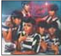
'The Electric Lady' Bad Boy

En este mundo competitivo que ciegamente cree en el crecimiento constante y en el que los logros y aciertos parecen convertirse en cargas insuperables, solo el discernimiento permite no apresarse a uno mismo. Tras el maravilloso 'The ArchAndroid', de 2010, Janelle Monáe bien podría haberse colapsado: ¿quién y cómo podía superar eso? La respuesta es sencilla: da igual, no hace falta ni superarlo ni no superarlo. Y así suena 'The Electric Lady', totalmente desestresado, un álbum tranquilo y sereno, que discurre sin forzarse ni pretender. Sí hay en él una llamativa presencia de tótems colaborando (Prince, Big Boi, Eriqah Badu), pero no da la impresión de que estén allí para enmascarar nada. De nuevo, el funk, el soul y el r'n'b discurren estupendamente, haciendo sentir al que escuche un bienestar contagioso, ganas de cantar y moverse, o recostarse y dejarse mecer. Es curioso que un álbum extenso como este, con 19 temas, mantenga el tipo y, aún más curioso, que su mejor desempeño lo logre en la segunda mitad. Nada de canciones de relleno para alargar: pedazos de soul de factura clásica robustecen un trabajo que solo decepcionará (y están en su derecho) a los que esperan que todo siempre sea más y mejor y original y nuevo y puro fuego de artefacto. — S. MAYOR