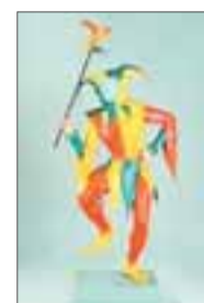
Chema Cobo (Tarifa, Cádiz 1952). 'Guardián del deseo', 1990. Pieza única. Pintura acrílica sobre madera y fibra de vidrio.

Su título, "El atentado", y fue realizada por el valenciano en 1964 con óleo y otras materias textiles sobre un lienzo en forma de diptico.