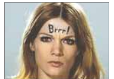
Un fotograma de 'No compteu amb els dits', pieza fascinante de Pere Portabella.

Su tercer largometraje, 'Tabú', fue doblemente premiado en la Berlinale 2012 y lo ha colocado no solo en primera línea del cine portugués actual (junto a Pedro Costa), sino también en la cabecera de la vanguardia internacional junto a Lisandro Alonso o Albert Serra. Por su intriga narrativa, el magistral juego de diálogos y la banda sonora que ritma la película, 'Tabú' emerge como una película muy elaborada que destaca claramente por encima de la filmografía de sus compañeros de vanguardia