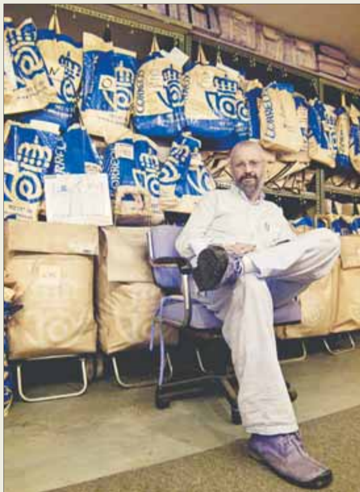
Museo de lo imposible.

Y más sobres, paquetes, fotografías y objetos, todos girando gravitatoriamente alrededor de la figura de su custodio. De su padre y de su madre, de su amigo. De su alma. Del que conoce todos sus secretos e historias. Anécdotas del camino que solo posee aquel que lo ha caminado. Ternura, conocimiento y juego.