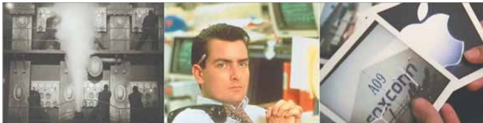
Imágenes del capitalismo: los trabajadores de 'Metrópolis' (1927), 'Wall Street' (1987) y 'Made in China' (documental, 2013).

Así pues, la imagen de la economía actual se resume en transacciones financieras, flujos de