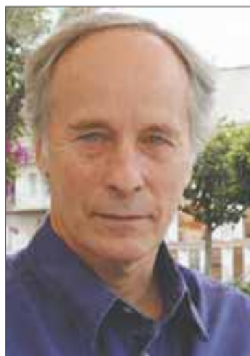
Richard Ford es conocido en Francia como el Clint Eastwood de las letras.

Ford empezó a escribir sobre la peripecia de Dell Parsons precisamente en su casa de Montana, en 1989, Estado en el que vive la familia Parsons al inicio de 'Canadá'. En ese momento, Richard Ford ya gozaba de un gran reconocimiento público y de crítica, ya que su novela 'El periodista deportivo' había conseguido conectar definitivamente a Ford con su público y consiguió ser finalista del PEN/Faulkner de Ficción en 1986. Sin embargo, después de aquellas veinte páginas, la historia de Dell quedó en fase de letargo, ya que otras historias afluyeron a su pluma. En