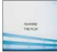
'Rewind the film' Columbia

Si la diferencia entre una fábrica y un taller no es solo la cantidad de la producción, sino también la calidad de la misma, entonces Manic Street Preachers son lo segundo. Son prolíficos y tienen un tono compositivo que, como Neil Young o The Fall, parece algo incontinente... pero luego uno escucha el resultado y dice: "funciona". Manic Street Preachers han mantenido siempre el equilibrio en ese punto donde el rock y el punk coinciden en cuanto a carga simbólica y mensaje letrístico, y donde el pop añade una factura inmediata y efectiva que da al conjunto una accesibilidad por momentos irresistible. La discografía de la banda está llena de ejemplos, desde 'She is Suffering' pasando por 'A Design for Life'. Dos décadas de producción llevan ahora a este álbum reposado y con tonos menos adustos, donde los arreglos son tenues, abunda lo acústico, hay vientos y el tono es reflexivo y un punto espectral. Y como siempre, melodías reconocibles, una belleza compositiva que parece estructural y la sensación que, cada vez más, Manic Street Preachers suenan clásicos respecto a sí mismos, pero también en un sentido general. Su discurso fluye con tanta solvencia que dan ganas de escucharlos, a menos que uno viva solamente instalado en la vanguardia.