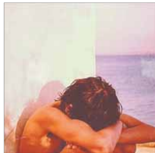
La sal es una sustancia corrosiva, como el tiempo...

En definitiva, a través de una prosa poética con vestigios de algunas grandes novelas del siglo XX, el lector quedará quizá atrapado en el vaivén especular que crea su lectura. En efecto: como su título palindrómico ya indica (l-a-s-a-l, en francés también: l-e-s-e-l), la segunda novela del joven y ya gran Jean-Baptiste Del Amo es como un espejo donde uno puede verse reflejado, literatura de ida y