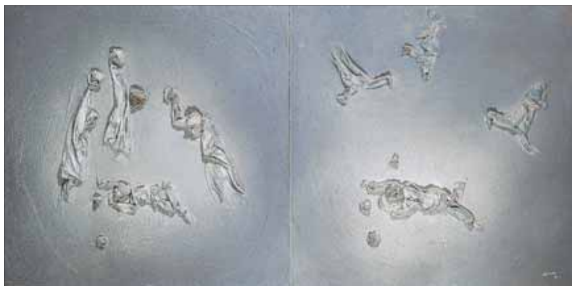
Juan Genovés (Valencia, 1930). 'El atentado', 1964. Díptico, óleo, materia y textiles sobre lienzo. Firmado y fechado. 85 x 170 cm.

neos valencianos como Manolo Valdés, Carmen Calvo, Juan Genovés o Jordi Teixidor.