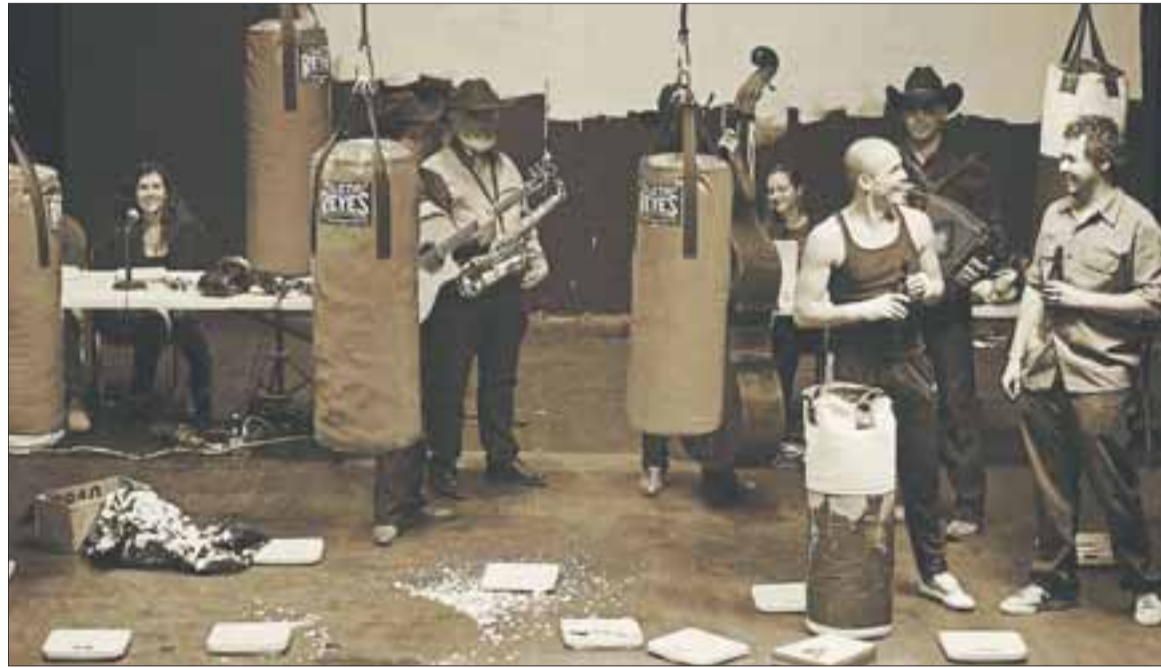
Más allá de los géneros, una imagen de 'Baños Roma' de la compañía mexicana TLS.

Dos espectáculos de compañías mexicanas destacaron especialmente por la radicalidad de sus apuestas. Teatro Línea de Sombra (TLS) propuso una obra excelente titulada "Baños Roma". El espectador asiste en ella a un recorrido multidisciplinar donde el texto, la interpretación, los objetos acumulados en la escena, la música en vivo y las proyecciones audiovisuales se entremezclan rítmicamente en torno a la vida del excampeón mundial de boxeo, José Ángel "Mantequilla" Nápoles.