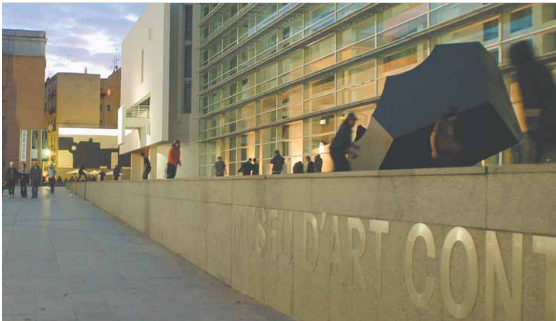
Vistas del edificio del Museu d'Art Contemporani de Barcelona.