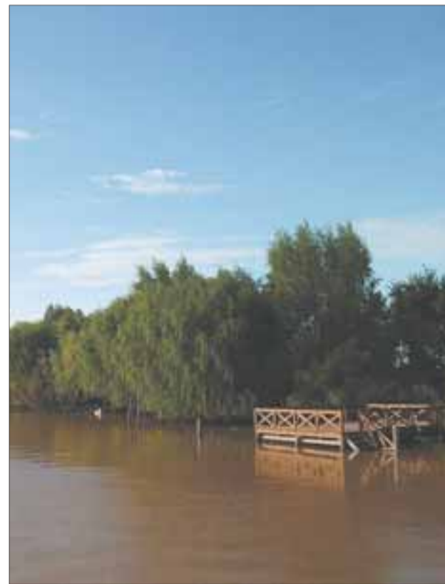
La naturaleza en la que se instaló Thoreau.

Y, claro, eso se corresponde inevitablemente con ‘Walden’. Una suerte de diario, de ensayo, de relato social, de novela, de libro filosófico. Más allá de las etiquetas, se trata de un libro para el que no pasa el tiempo. O, mejor aún, un libro cada vez más necesario y actual. Thoreau se refiere constantemente a cuestiones prácticas. Analiza la economía, lo introspectivo, los rasgos sociales. Siempre desde la perspectiva filosófica y reflexiva,