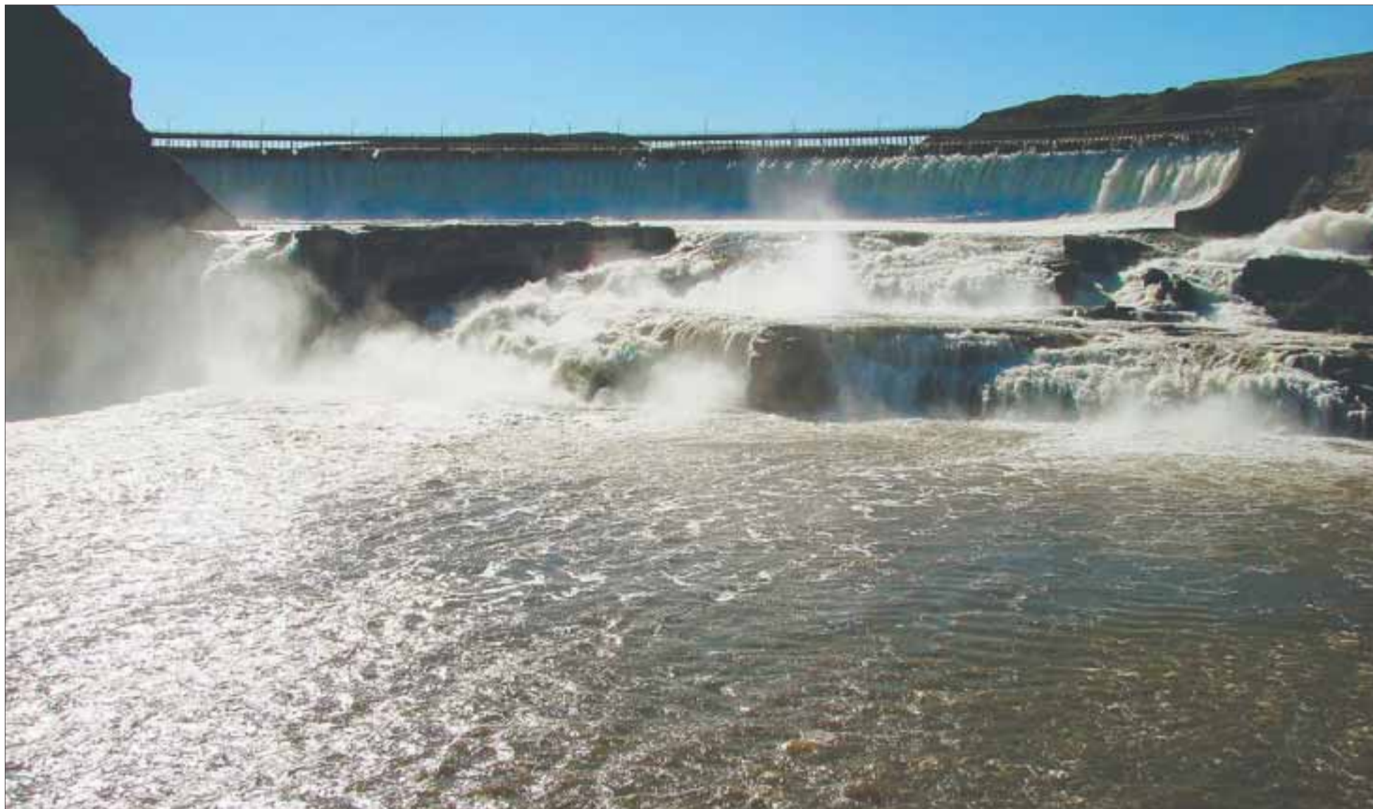
Great Falls es la ciudad donde empieza la historia de Dell Parsons, una ciudad que el autor conocía muy bien.