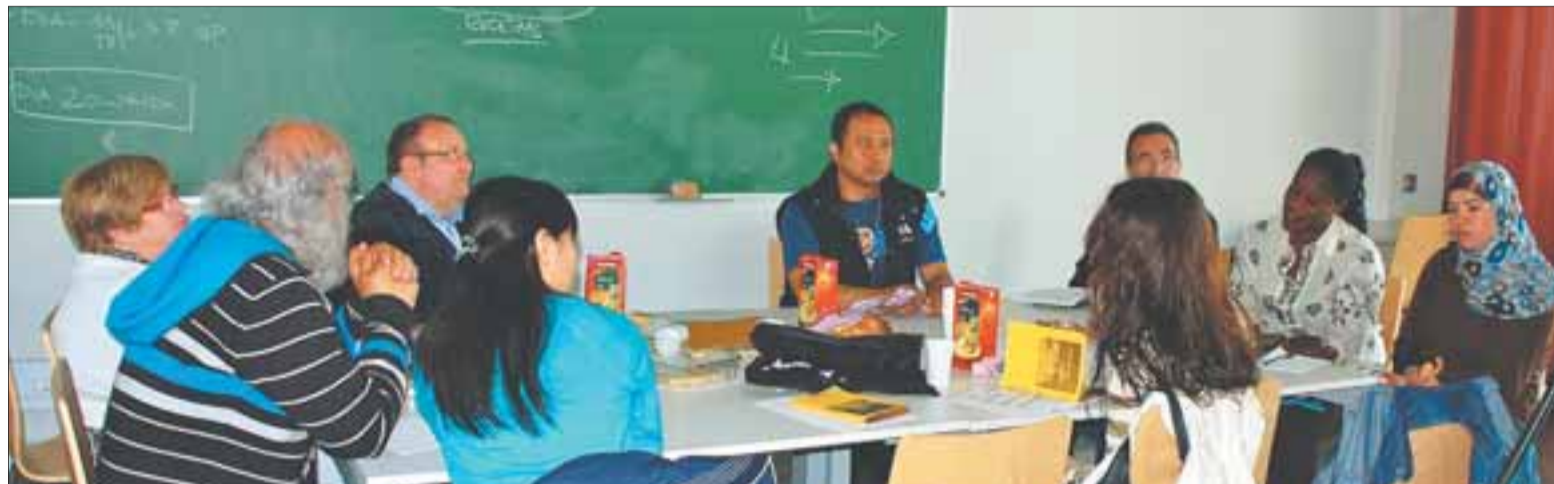
Los participantes en una de las reuniones de trabajo.

Estos parámetros nos aproximan a lo que se denomina “prácticas artísticas colaborativas”. Aunque existen múltiples definiciones y tipologías que a día de hoy continúan concretándose, podríamos afirmar que la característica fundamental de este tipo de prácticas consiste en ser un proceso de producción realizado en colaboración con la comunidad a la cual va dirigido. Es decir, el proceso de producción tiene lugar dentro de lo público, fuera del ámbito estricto del arte, y requiere una participación activa de la comunidad en cuestión. Ya no se trata, por tanto, de que la artista haga algo sobre una comunidad, sino de que esta