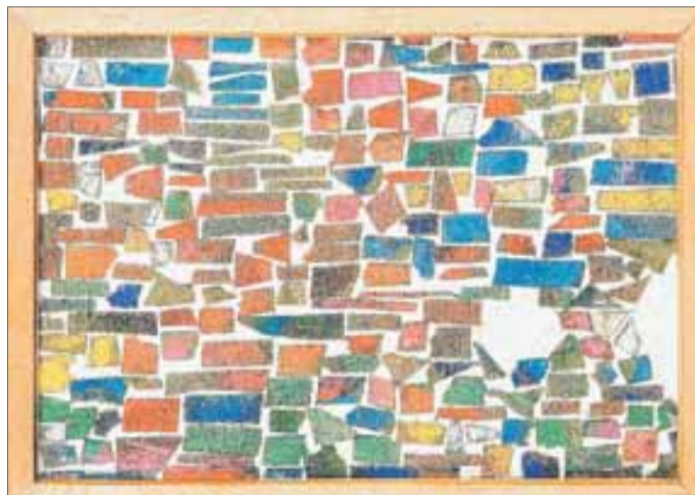
Carmen Calvo (Valencia, 1950). 'Serie Paletas', 1979. Óleo sobre pequeños trozos de papel de lija adheridos a tabla. Al dorso firmado y fechado 1979. 36 x 26,5 cm.

Entre los lotes, había varias obras de artistas contemporá-