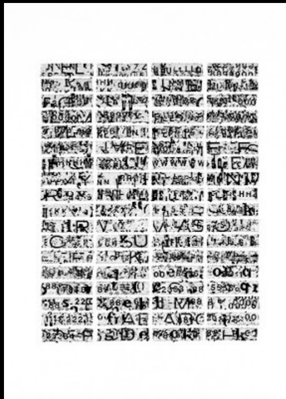
Ensaio para uma Nova Expressão da Escrita III, 1978

http://ocontrariodotempo.blogspot.com.es/