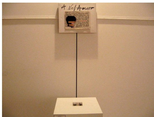
Sala de Exposición